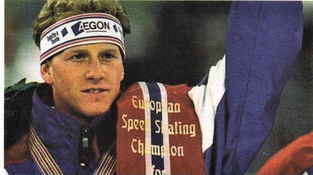
De beer van Lemmer