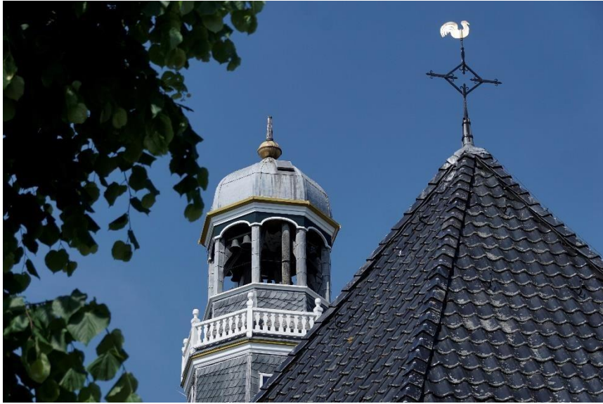
Enkele foto impressie's