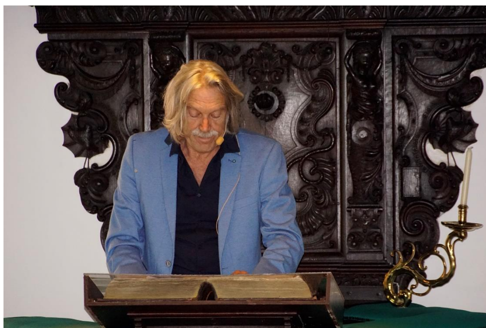
De Lemster Toer spreekt: Draagteksten gesproken door Job Degenaar.