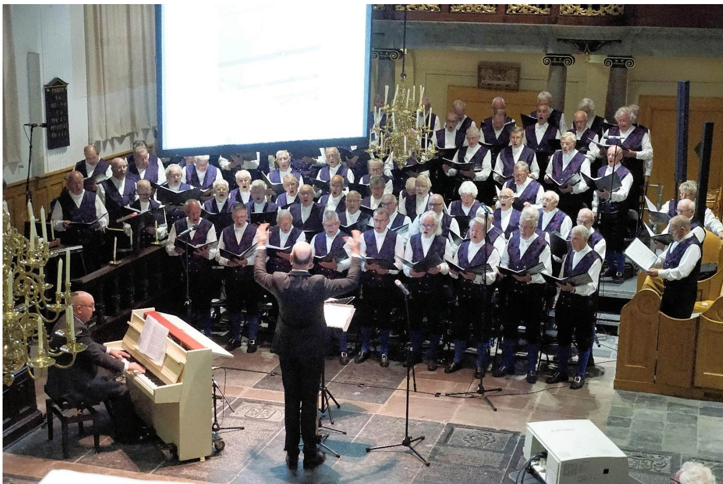
Het Lemster Mannenkoor zingt in Frysk Kostuum.